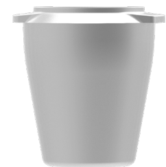
VASO DOSIFICADOR 55GR