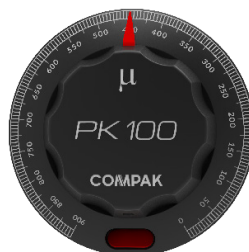
DIAL ALTA PRECISIÓN